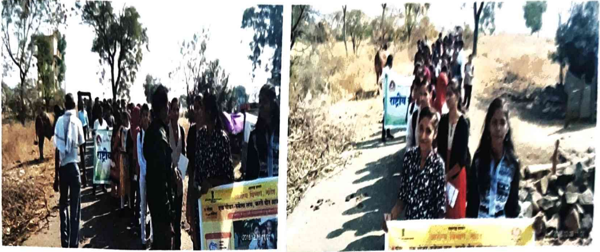
Gover Rubela Awareness rally organized on dated 28.01.2019 at Vasantnagar rural area.