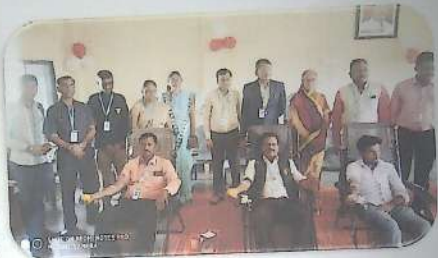
Blood donation camp on 11.02.2020