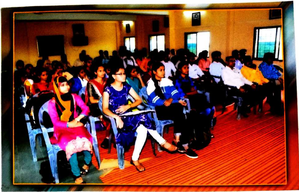
Introducing 'satellite & Technology' with number of student & staff, on the date 04/09/2019