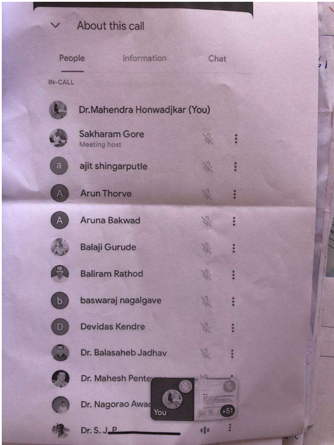
Beneficiary Students / Staff