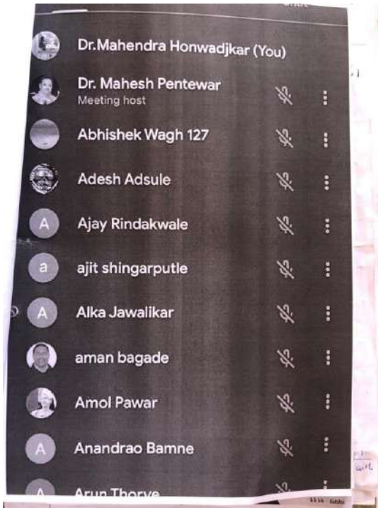
Beneficiary Students / Staff